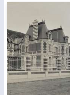
(reconstitution 3D sur l'application Baludik)

La villa Louis XIII, également surnommée villa Roxane, construite en 1908, fut mise gracieusement par Georges Dufayel à la disposition du Président du Conseil Belge, Charles de Broqueville, pour y établir sa résidence.