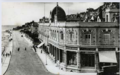
(reconstitution 3D sur l'application Baludik).

Situé au sein du Palais du Commerce, l'Hôtel des Régates fut le lieu d'hébergement des ministres plénipotentiaires accrédités auprès du gouvernement belge et des attachés militaires des autres nations alliées et amies de la Belgique. Immeuble également détruit en 1944.