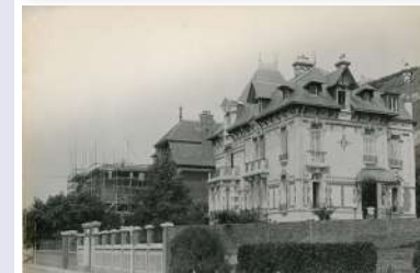
(reconstitution 3D sur l'application Baludik)

Première maison située à l'extrémité Est du boulevard Dufayel, cette villa de dix-huit pièces fut mise à la disposition du ministère des Affaires Etrangères. Cette villa devait disparaître lors de la Seconde Guerre mondiale.