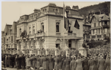
(reconstitution 3D sur l'application Baludik).

Cette vaste villa devait accueillir le ministère de la guerre. Construite par Georges Dufayel en 1912, elle a été le théâtre de toutes les manifestations patriotiques de la Belgique : défilés militaires, fête nationale du 21 juillet et jour de la Saint-Albert, mais fut détruite en 1944 par les forces alliées.