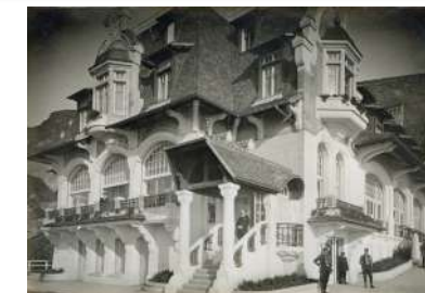
(reconstitution 3D sur l'application Baludik)

L'hôtelierie fut ainsi dans les faits le siège du gouvernement belge de novembre 1914 à novembre 1918 et c'est ici que fut préparée la restauration économique qui devait suivre la libération de la patrie. Il fut détruit en 1944 par les troupes d'occupation.